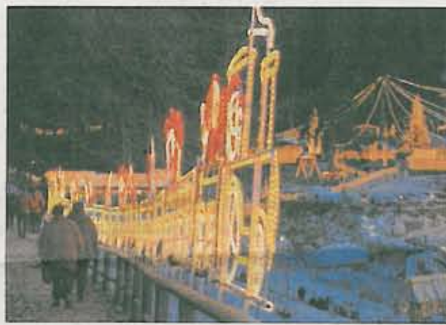
Ab morgen leuchten wieder 750 000 Lichter rund um den Wasserfall und tauchen das Winterdorf so in eine zauberhafte Atmosphäre.

Wenngleich noch jede Menge Arbeit wartet, bis der Weihnachtszauber ab morgen Mittag um 14 Uhr im Glanz von 750 000 Lichtern erstrahlt. So sind die