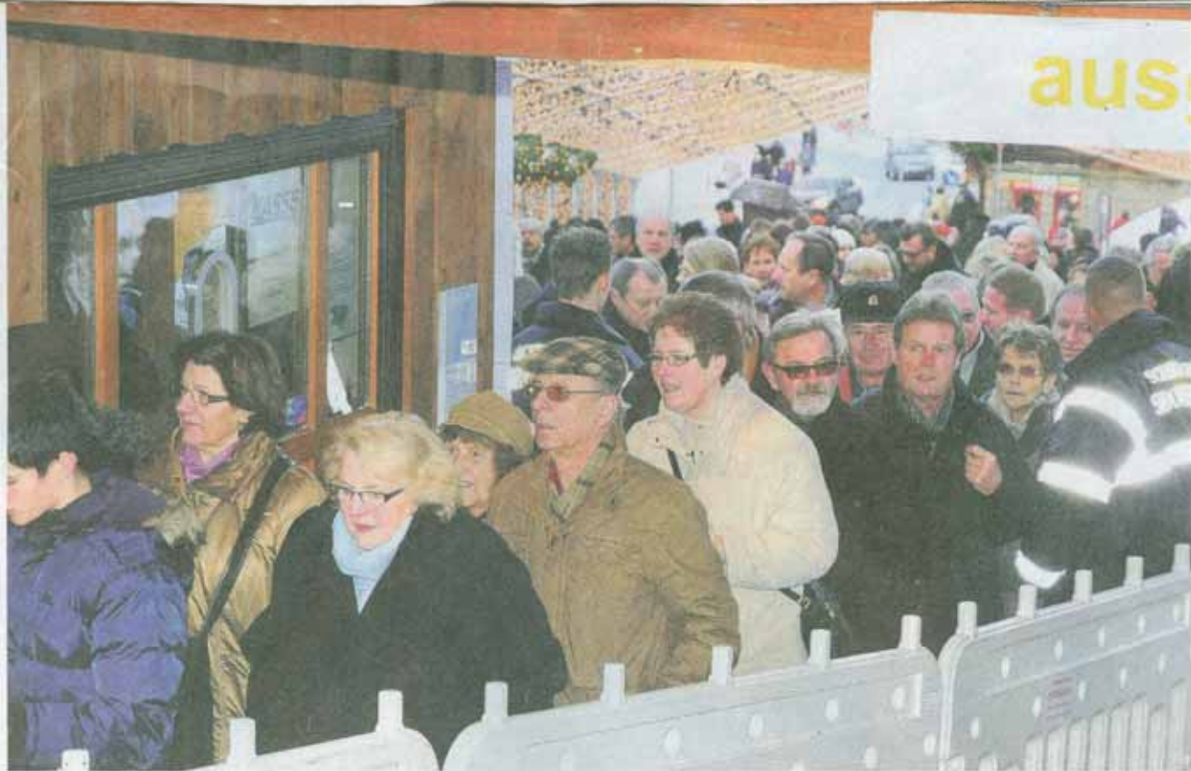
Am Mittwoch war der bisher besucherstärkste Tag auf dem Triburger Weihnachtszauber. Rund 9000 Menschen wollten das Lichtermeer sehen. Kurzzeitig musste das Areal sogar gesperrt werden.